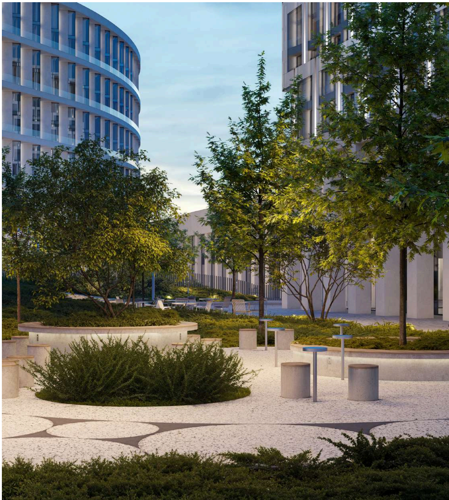
Зона коворкинга у бизнес-центра

Важными связующими элементами всей территории являются озеленение, освещение и мощение. При разработке концепции озеленения команда бюро акцентировала внимание на «скульптурности» холмов и создании атмосферы зеленого оазиса, сохраняя свойственный для дикой природы «хаос». Тщательный подход в подборе ассортимента растений