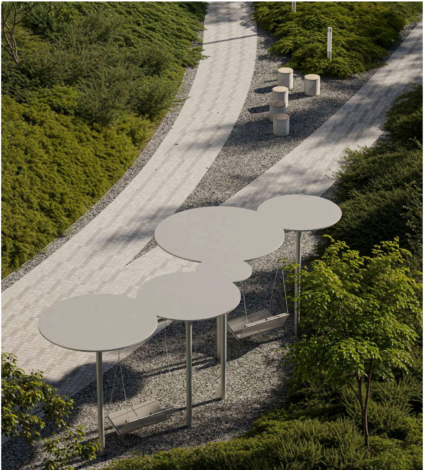
Навес с качелями